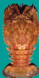
Cigale de mer TIANEE

Taille minimale autorisée / faito nai'nai fa'ati'a hia : 14 cm