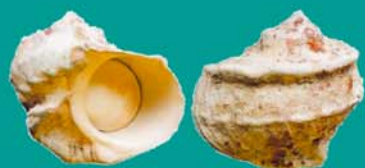
Burgau MAOA TARATONI