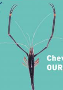
Chevrette OURA PAPE

Taille minimale autorisée / faito nai'nai fa'ati'a hia : 6 cm