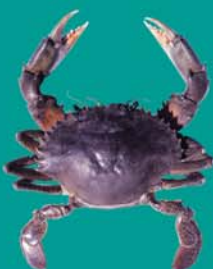
Crabe vert UPAI

Taille minimale autorisée / faito nai'nai fa'ati'a hia : 12 cm