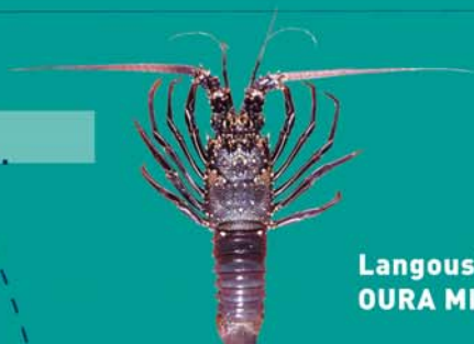
Langouste OURA MITI

Taille minimale autorisée / faito nai'nai fa'ati'a hia : 12 cm